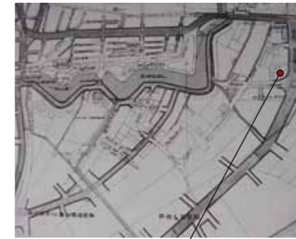
Burggravenlaan in 1929; tussen stad en polder