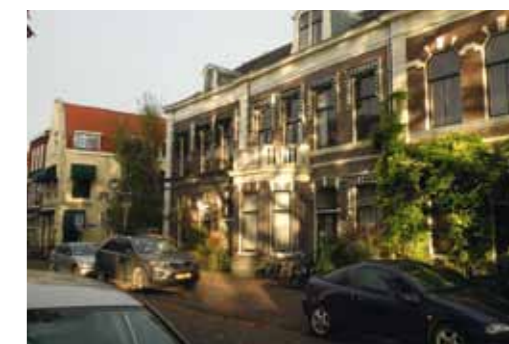
< Nieuw & Oud ^

vrijwilligers. Issoria Magazine wordt kosteloos gedrukt door Okay Color Graphics Alphen a/d Rijn in een oplage van 1.600 stuks.