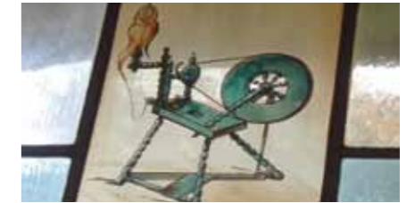
Origineel glas in lood in huiskamer