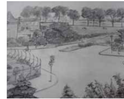
Potloodtekening van het jongetje Bosch van uitzicht uit het pand Burggravenlaan 11