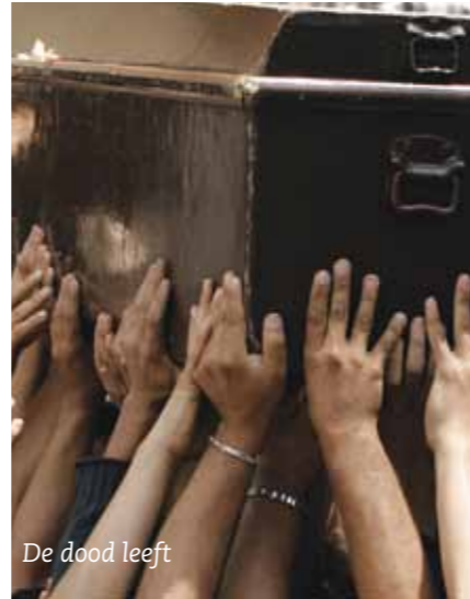
De dood leeft

Tot en met 26 augustus 2012 is in het Tropenmuseum in Amsterdam de tentoon-