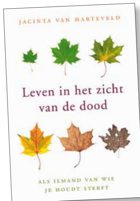
Vóór 19,95 in de boekhandel