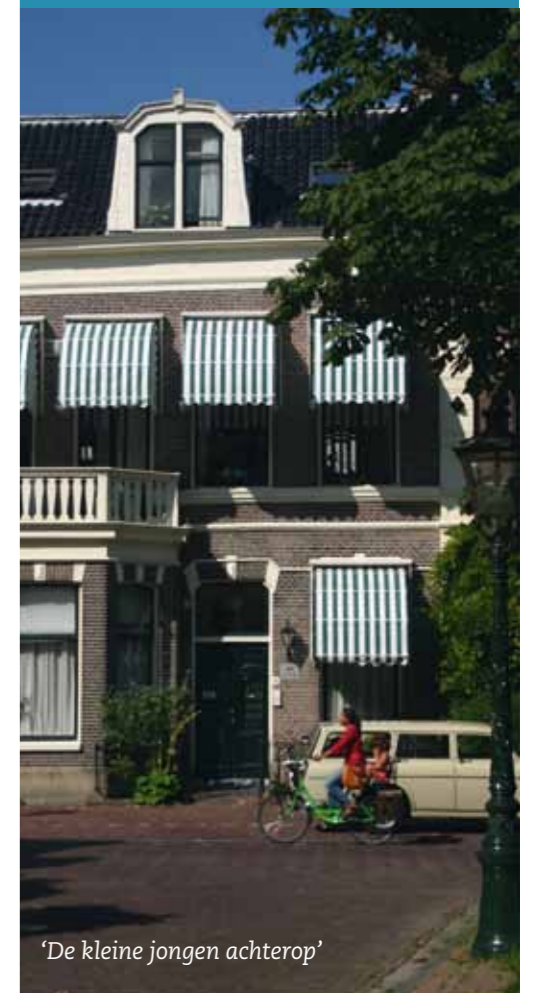
'De kleine jongen achterop'