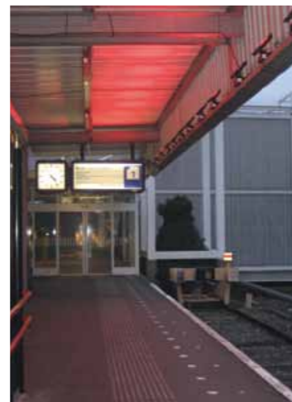
Gekleurd licht is wachtverzachter!